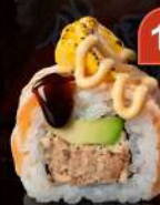
M5 CHEESE Salmone grigliata, avocado, cetriolo, salmone flame, cheese spicy, teriyaki