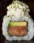
M6 PHILA Salmone, avocado, philadelphia, prezzemolo