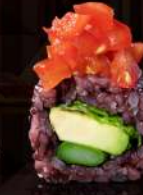
M27 VENERE Avocado, asparago, lollo, pomodorini