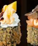
M43 TARTUFO FURAI Salmone tartar, spicy, teriyaki, tartufo