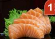
25 SALMON SASHIMI (5 pz)