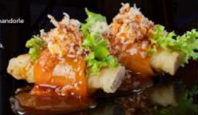
33 MANGO HANAROLL Salmone, avocado, lollo, mango, pistacchio