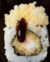
M15 EBITEN Gamberi tempura, mayo, tempura, teriyaki