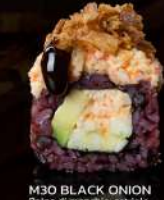
M30 BLACK ONION Polpa di granchio, cetriolo, avocado, mayo, polpa di granchio, cipolla fritto, teriyaki