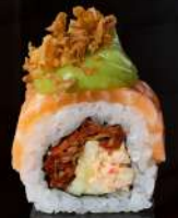
M29 GUAKAMOLE Polpa di granchio, cetriolo, pomodoro secco, salmone, guacamole, cipolla fritto