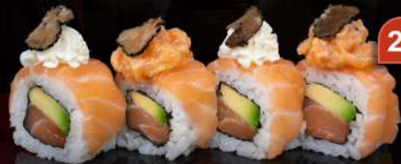
M12 TARTUFO Salmone, avocado, philadelphia, salmone tartar, tartufo