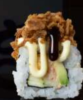
M28 ONION Polpa di granchio, cetriolo, avocado, mayo, cipolla fritto, teriyaki