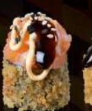
M42 MANGO FURAI Philadelphia, mango, spicy, teriyaki