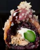
M2 BLACK SALMON Salmone grigliata, philadelphia, asparago, salmone, tempura, mirin mayo, teriyaki