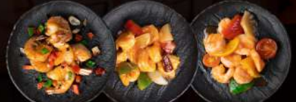
71 GAMBERI SALE PEPE 72 GAMBERI GONGBAO 73 GAMBERI ORANGE