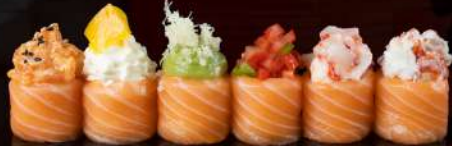
42 MIX GUNKAN