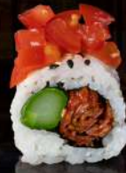
M26 TOMATO Pomodoro secco, asparago, pomodorini