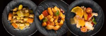
74 POLLO CURRY 75 POLLO GONGBAO 76 POLLO ORANGE