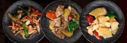
68 MANZO CIPOLLA PEPPERONE 69 MANZO PATATE 70 POLLO PATATE