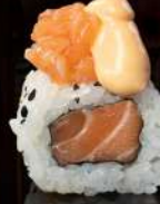
M8 SPICY Salmone, salmone tartar, salsa spicy