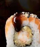
M20 TIGER Gamberi tempura, mayo, salmone, sesamo, teriyaki