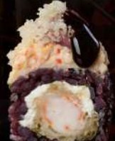
M19 BLACK EBI Gamberi tempura, philadelphia, polpa di granchio, mirin mayo, tempura, teriyaki