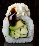
M25 YASAI Avocado, cetriolo, lollo, philadelphia, teriyaki