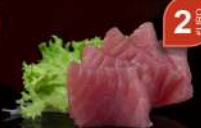
26 TUNA SASHIMI (5 pz)