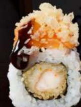
M13 HOT Gamberi tempura, mayo, salmone tartar, tempura, teriyaki, spicy