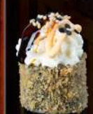
M40 PHILA FURAI Philadelphia, spicy, teriyaki