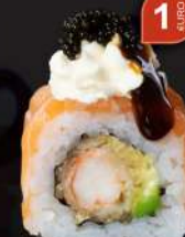
M14 DELUX Gamberi tempura, avocado, philadelphia, salmone tartar, uova di lompo, teriyaki