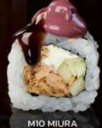
M10 MIURA Salmone grigliata, cetriolo, philadelphia, mirin mayo, teriyaki