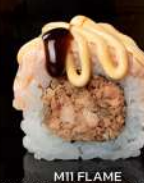
M11 FLAME Salmone grigliato, salmone scottato, teriyaki, spicy, sesamo