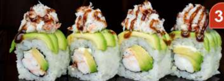
M35 ASTICE Gambero al vapore, mayo, avocado, astice, teriyaki