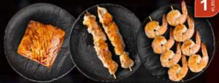
61 SALMONE 63 SPIEDINI POLLO 64 SPIEDINI GAMBERI