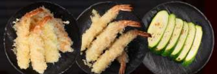
65 TEMPURA MIX 66 TEMPURA EBI 67 ZUCCHINE