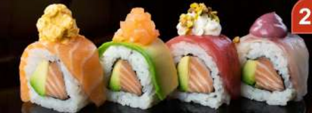
M34 RAINBOW Salmone, avocado, pesce e topping misti