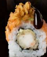
M18 HAVANA Gamberi tempura, mayo, salmone, guacamole, cipolla fritto, teriyaki