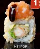
M31 POP Gamberi tempura, avocado, mayo, riso soffiato, salmone tartar, philadelphia, teriyaki