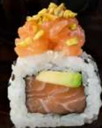
M4 SALMON Salmone, avocado, salmone tartar, pistacchio