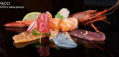
11 TUNA CARPACCI Servito con olio EVO e salsa ponzu