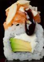
M3 ALMOND Avocado, philadelphia, mandorle, salmone tartar, teriyaki